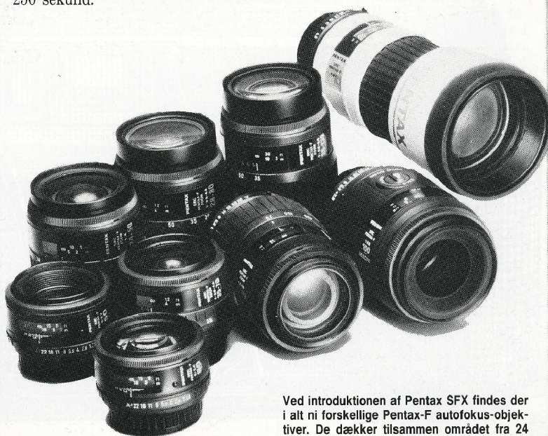
Ved introduktionen af Pentax SFX findes der i alt ni forskellige Pentax-F autofokus-objektiver. De dækker tilsammen området fra 24 mm vidvinkel til 300 mm tele.

* Pentax SFX forventes at skulle koste under 6.500 kroner inklusive normalobjektiv. Levering i maj måned.