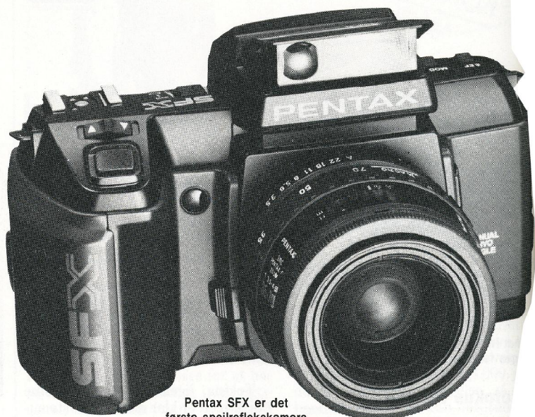
Pentax SFX er det første spejlreflekskamera med indbygget flash.

Både når man bruger den indbyggede flash og en ekstern af dedicated typen, så måles eksponeringen på selve filmen og styres af kameraets computerchips. Pentax SFX giver således fine muligheder for kombination af flash- og dagslys, blot med den begrænsning, at korteste synktid er 1/100 sekund. Her går de skrappeste konkurrenter op til 1/250 sekund.